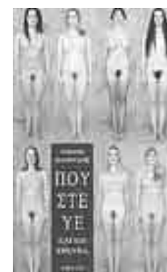
Τζίμης Πανούσης ΠΟΥ ΣΤΕ ΥΕ ΜΗ ΕΡΕΥΝΑ

Το γέλιο της τηλεόρασης, ακόμη και όταν είναι επιτυχημένο όπως στην περίπτωση του Λαζόπουλου, είναι γέλιο που στηρίζεται στην «κοινή συναίνεση». Προϋποθέτει ένα κοινό αίσθημα, όπως επίσης προϋποθέτει και τη συμφωνία ως προς το τι είναι αστειό και τι είναι σοβαρό, τι είναι και πώς συμπερι-