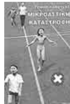
Τζίμης Πανούσης ΜΙΚΡΟΑΣΤΙΚΗ ΚΑΤΑΣΤΡΟΦΗ

Αυτό που σίγουρα δεν μπορεί να του αρνηθεί κανείς είναι ότι ο Πανούσης «έχει τον τρόπο του». Απ' την εμφάνιση ως τον τόνο της φωνής κι απ' την επιλογή των θεμάτων ως τη χρήση της γλώσσας έχει καταφέρει μέσα στα τόσα χρόνια να φτιάξει μια κωμική φιγούρα εντελώς ιδιαίτερη και σίγουρα μοναδική. Δοκίμασε να μεταφέρει ένα αστέιο του – πολλά μοιάζουν με ανέκδοτα – και θα δεις πως είναι αδύνατον να λειτουργήσει. Κι είναι αυτή η μοναδικότητά του που κάνει τη σάτιρά του και ανατρεπτική και το κυριότερο πολιτική, κατά συνέπεια εξυγιαντική για μια κοινωνία η οποία έχει καταντήσει να κρίνει τους πολιτικούς της από το πόσο σοβαρό ύφος μπορούν να υιοθετήσουν όταν κάνουν δηλώσεις στην τηλεόραση ύστερα από κάποιο τραγικό δυστύχημα.